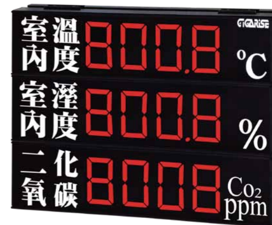
顯示字體：4" 4位數加參欄中文參層顯示 外框尺寸：長45cm×寬65cm×厚7cm