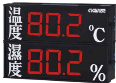
顯示字體：4" 3位數加中文雙層顯示 外框尺寸：長30cm×寬45cm×厚7cm