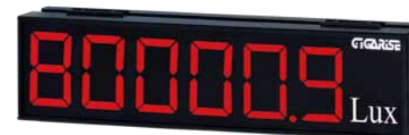
顯示字體：4" 6位數單層顯示 外框尺寸：長15cm×寬65cm×厚7cm