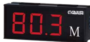
顯示字體：4" 3位數單層顯示 外框尺寸：長15cm×寬37cm×厚7cm