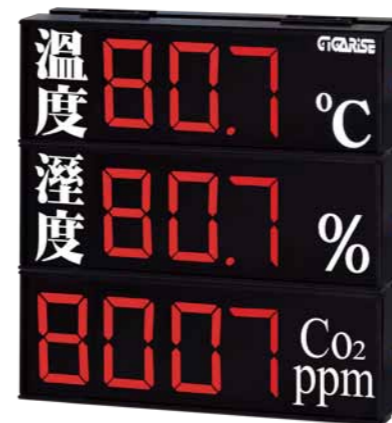
顯示字體：4" 3+4位數混合加中文參層顯示 外框尺寸：長45cm×寬45cm×厚7cm