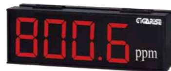
顯示字體：4" 4位數單層顯示 外框尺寸：長15cm×寬45cm×厚7cm