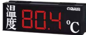
顯示字體：4" 3位數加中文單層顯示 外框尺寸：長15cm×寬45cm×厚7cm