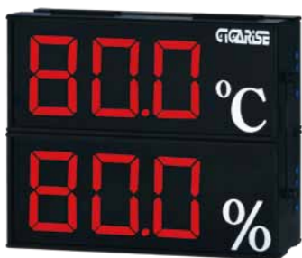
顯示字體：4" 3位數雙層顯示 外框尺寸：長30cm×寬37cm×厚7cm